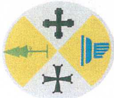
Tabella riepilogativa dei principali adempimenti in materia di trasparenza, anticorruzione e ciclo di gestione della performance - Regione Calabria ed enti strumentali sottoposti all'OIV della Giunta regionale in base all'art. 2, comma 2, legge regionale 3/2012 e all'art. 13, comma 8, l.r. 69/2012 1 (aggiornamento all'8 aprile 2016)